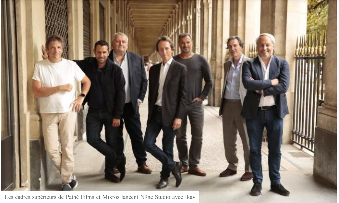
Les cadres supérieurs de Pathé Films et Mikros lancent N9ne Studio avec Ikav

Les principaux acteurs européens de l'industrie, dont les cadres supérieurs de Pathé Films, Mikros, Wild Bunch Distribution et Warner Bros., ont uni leurs forces pour lancer une bannière de production à guichet unique appelée N9ne Studio. La société prévoit d'investir plus de 30 millions d'euros (31 millions de dollars) au cours des cinq prochaines années pour financer entièrement le développement du contenu.